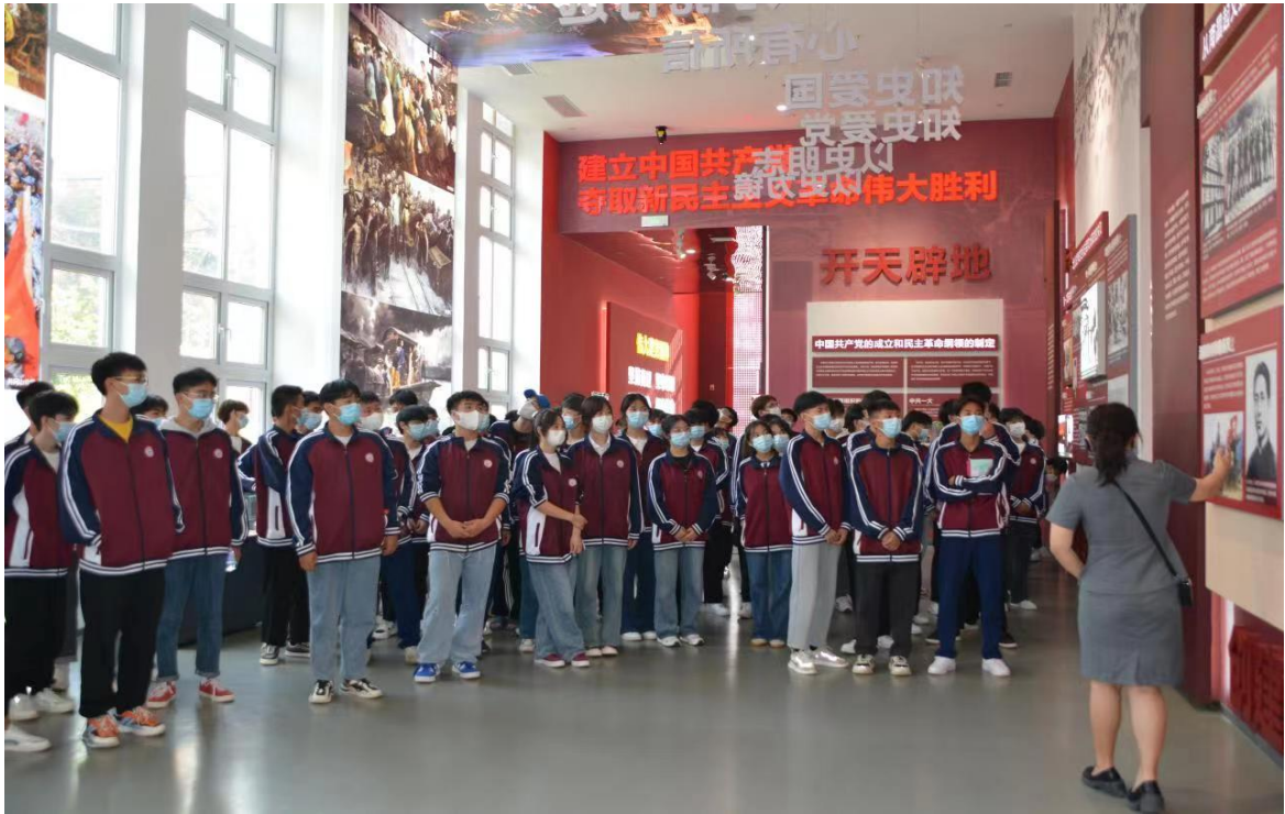
图3 鹿邑县职业技术学校组织学生参观党历史博物馆

3.在校体验。 全县各职业学校秉承“以人为本、关爱学生、培养学生、发展学生”的办学宗旨，落实“立德树人”根本任务，注重素质培养，坚持文化育人、活动育人，学生、家长、教职工及用人单位满意度高。