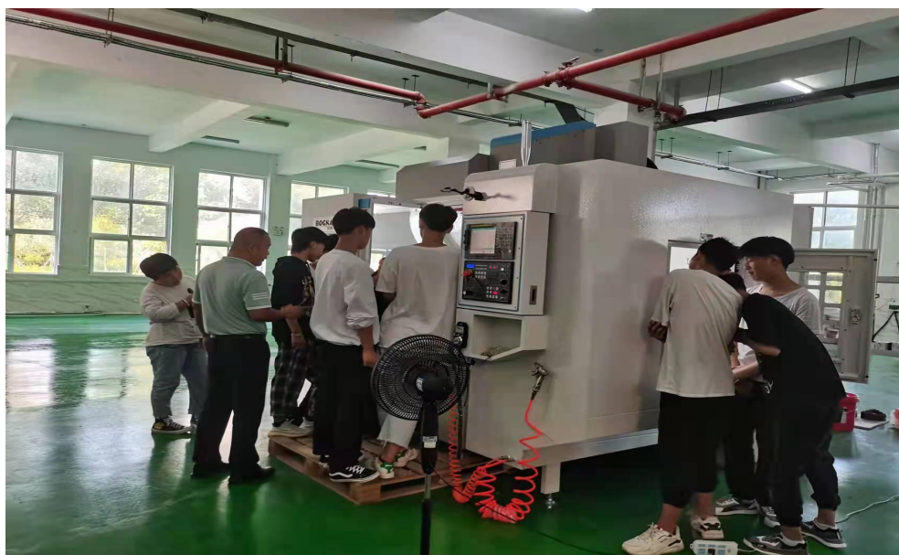
17 2022 级烹饪班学生实操课

播销售，学生在展示自身学习水平的同时，也增加了收入，为企业产品开辟了新的销售途径，实现了三赢。该专业开设以来，直播销售澄明食品产品 20 多种，销售额 130 余万元。