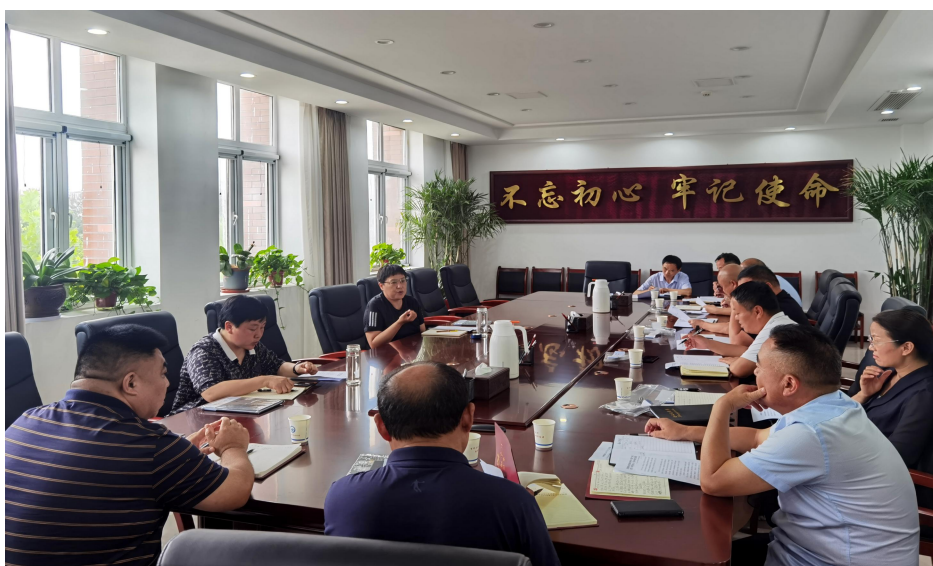
图1 县教体局召开党建专题会，研究部署2023年党建工作

各职业学校党组织，深入推进全面从严治党，认真落实党风廉政建设主体责任和“一岗双责”，把党风廉政建设与职业教育教学各项工作同部署、同落实、同考评。组织党员干部认真学习贯彻《中国共产党廉洁自律准则》《中国共产党问责条例》等，不断加强党的纪律建设、作风建设和廉政建设。坚持开展“廉政文化进校园”活动常态化，不断增强广大党员干部的廉政意识和拒腐防变能力。