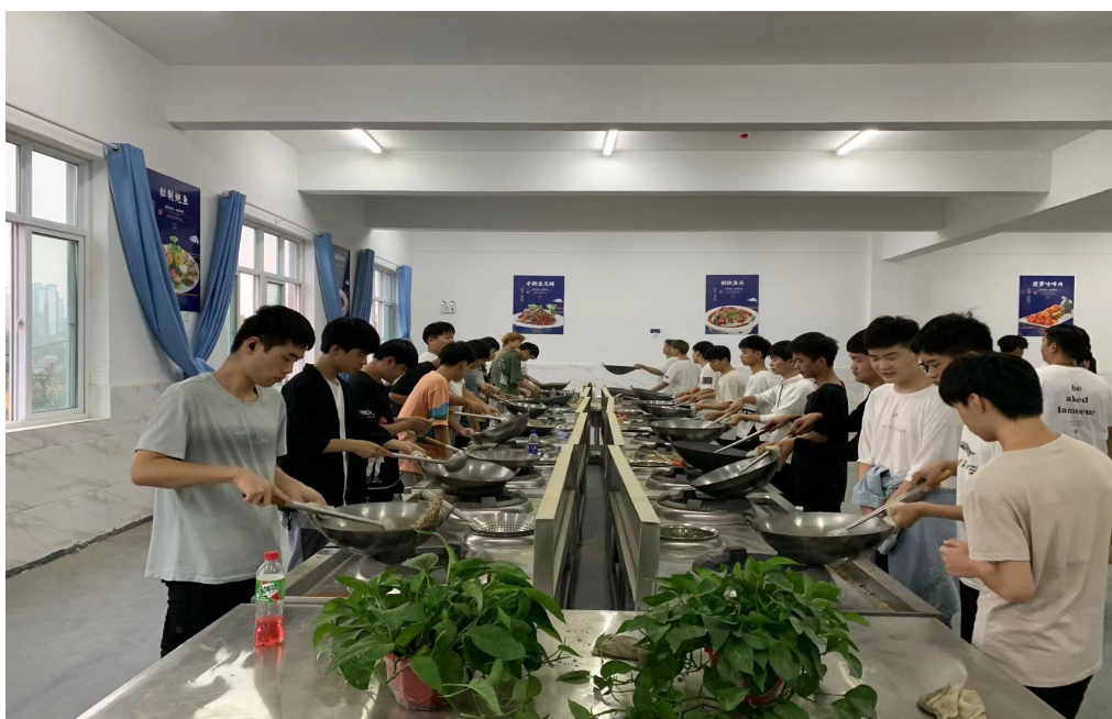
图 18 2022 级数控机床班学生实操课