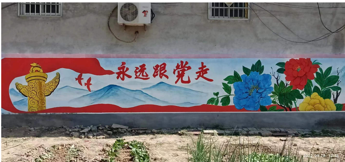
图 15 鹿邑县职业技术学校绘画专业学生开展绘制文化墙活动

各职业学校利用专业优势，服务地方发展。为提升村民的思想素质，促进文明和谐乡风民俗的形成，鹿邑职业技术学校以乡村振兴为宗旨，以绘制文化墙为载体，搭建了学校和基层沟通的纽带，在环境、文化、生态等方面助推乡村文化的发展。