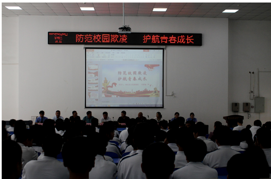
图 4 鹿邑县职业技术学校组织开展传统文化系列讲座

训方面感觉满意或基本满意,超过 93%的学生对校园文化与社团活动方面感觉满意或基本满意,超过 95%的学生对在校学习生活、学校安全方面满意度感觉满意或基本满意。