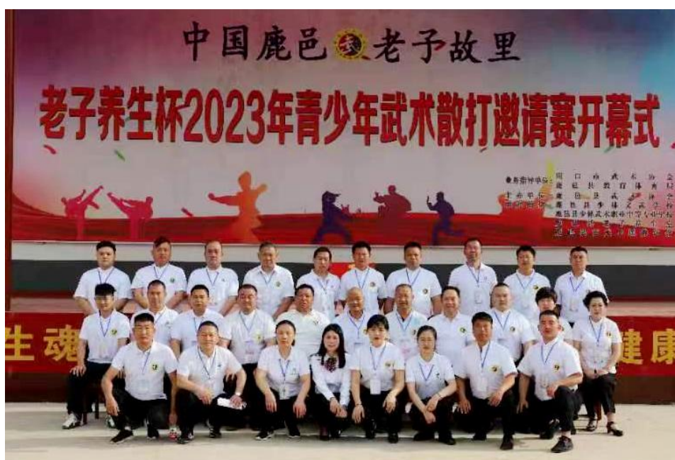
图 7 “老子养生杯” 2023 年青少年武术散打邀请赛评委