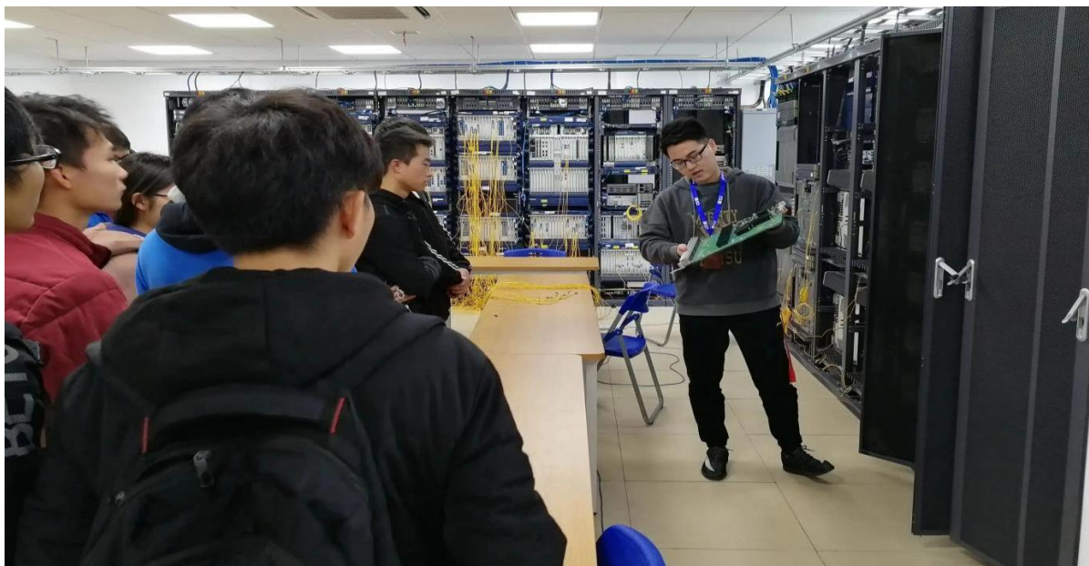
图 10 企业专业人士为我校学生讲解专业知识