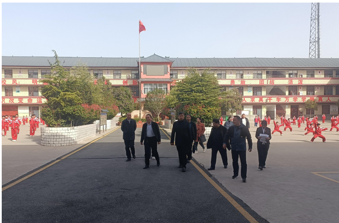
图 19 2023 年 11 月 16 日，教育局厅等五部门专家进行验收

（二）地方政策落实。鹿邑县委、县政府高度重视职业教育的发展，县政府出台文件将职业教育纳入政府目标考核体系。优化教育支出结构，持续加大职业教育投入，确保新增财政性教育经费向职业教育倾斜。学校基本建设、实验实训设备、教师培训、生均经费（生均公用经费）等正常办学经费，有稳定、可靠来源和切实保障。职业学校生均财政拨款不低于当地普通高中。整体提高职业学校基本办学条件，确保我县职业技术学校标准化建设达标。教育主管部门将职业教育招生工作纳入目标管理，出台了《鹿邑县教育局关于做好 2023 年中等职业学校招生工作的