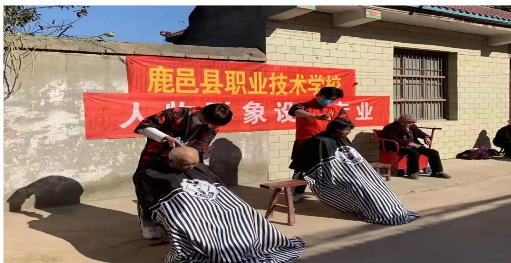
图 16 鹿邑县职业技术学校“美容美发”专业学生深入社区，开设免费理发

(四) 服务地方社区。各校始终坚持“开放办学、服务社会”，充分发挥师资、设备条件等资源优势，为社会经济发展提供动力“引擎”。一是在保障学生正常实习的基础上，让专业课教师带领学生走出校园，走向社会，走向社区，为老百姓提供上门服务，受到社会各界的好评。二是组织计算机应用专业的学生在街头设立自动化办公服务点，为老百姓免费提供复印、打印等自动化办公技术培训服务。三是选派骨干教师到社区参加电器维修等校外便民服务咨询点，帮助市民解决相关问题，普及电器使用等安全常识；学校美容美发专业深入社区，开设免费理发、一元理发服务，受到当地群众好评。既塑造了学校的良好形象，又给学生提供了良好的实践操作机会。四是积极倡导教职工义务到社区、敬老院等地开展捐赠、心理咨询、帮扶等“献爱心”便民服务。通过这些活动，向公众充分展示了职业教育改革发展成果，传播职业教育正能量、好声音、新形象，扩大了职业教育的社会影响力。