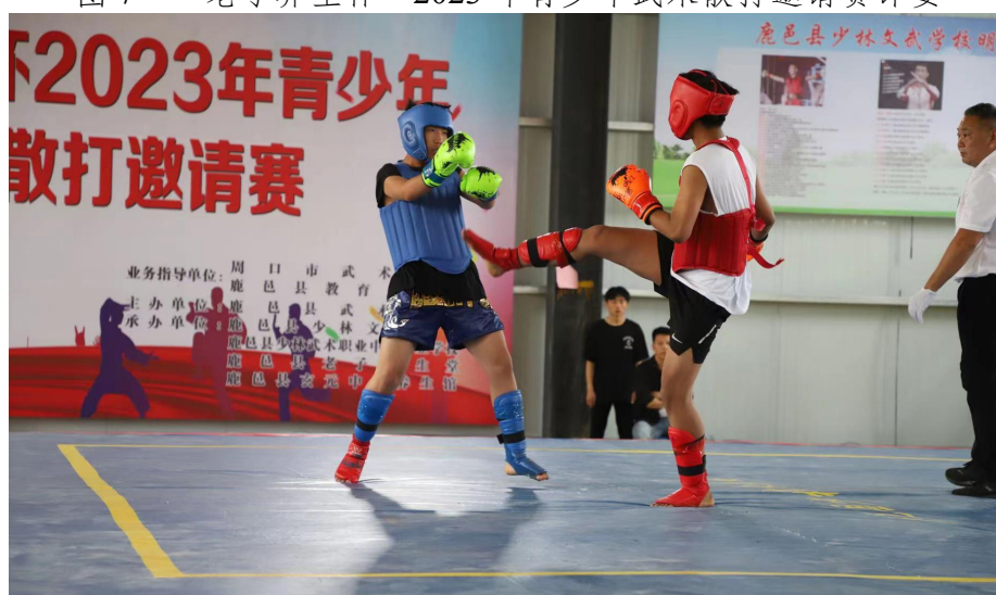
图 8 “老子养生杯” 2023 年青少年武术散打学生