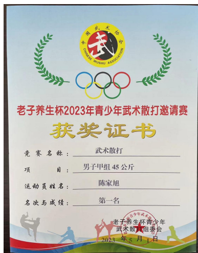
图9 “老子养生杯”2023年青少年武术散打邀请赛获奖证书