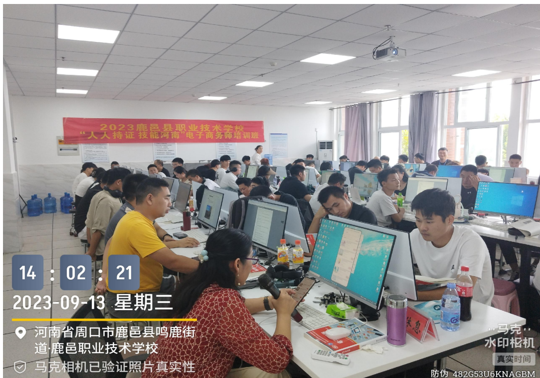
图 13 鹿邑县职业技术学校电子商务师培训班