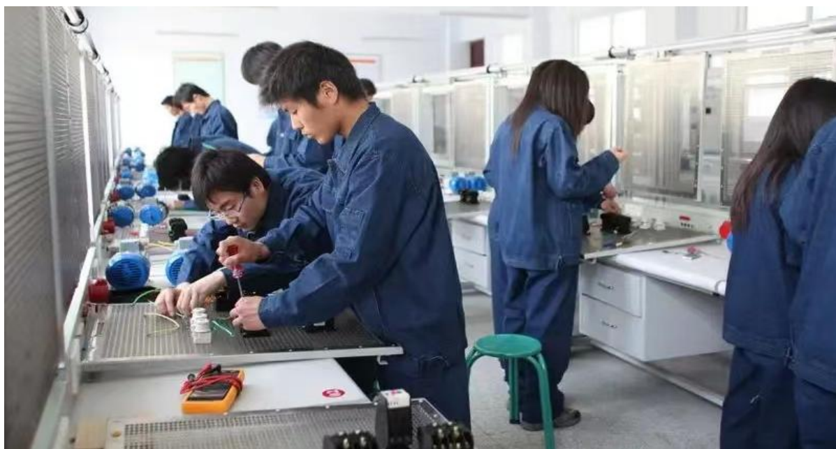
图 11 学生企业实习

4.教材建设。 各职业学校严格按国家和省有关规定使用公共基础课、专业课教材。专业技能课在选用国规、省荐教材的基础