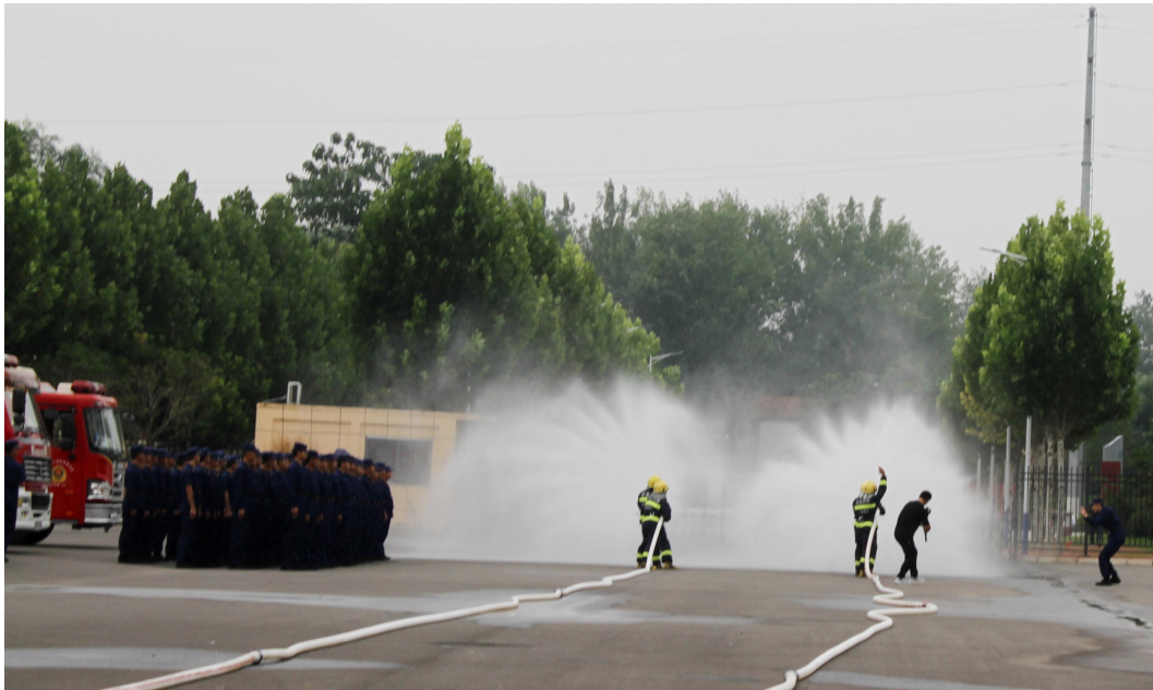
图 12 鹿邑县乡镇专职消防员