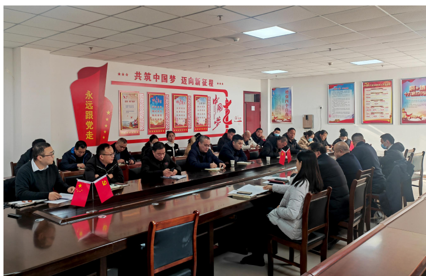
图2 鹿邑县职业技术学校党支部召开工作布置会

学生社团定期举办各种才艺表演活动，学生业余生活丰富多彩。各校开设了职业生涯规划课程，邀请企业领导和成功校友来校作报告，组织学生进行职业生涯规划设计竞赛。根据企业岗位特点，制定了不同专业的职业行为规范。