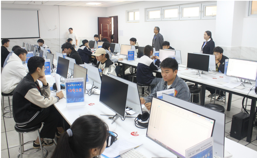
图 14 鹿邑县职业技术学校学生参加技能大赛

各职业学校利用专业优势，服务地方发展。为提升村民的思想素质，促进文明和谐乡风民俗的形成，鹿邑职业技术学校以乡村振兴为宗旨，以绘制文化墙为载体，搭建了学校和基层沟通的纽带，在环境、文化、生态等方面助推乡村文化的发展。