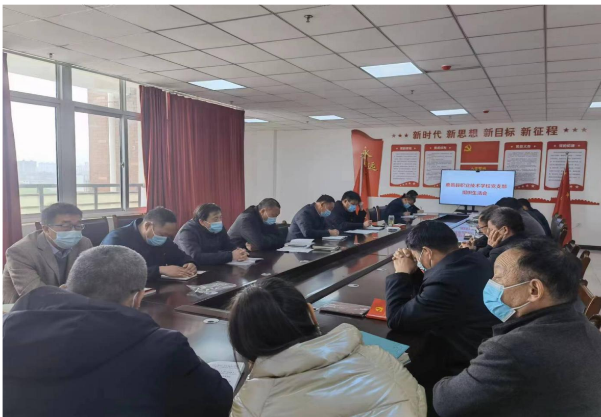
1.1.2图 鹿邑县职业技术学校党支部召开工作布置会

1.2 立德树人。 鹿邑县职业教育始终注重学生思想品德教育，各职业学校切实落实立德树人根本任务，弘扬社会主义核心价值观，结合专业特点抓好课堂教学主渠道，分阶段对学生开展理想信念、遵纪守法、文明礼仪、职业道德、心理健康和就业创业六大主题教育；利用校内外德育基地和重要节日对学生进行革命传统教育、爱国主义教育、诚信感恩教育和生命安全教育等。组织学生志愿者参加社会实践活动和走进养老院进行尊老敬老等慰问活动；组织开展文明礼貌月和学习雷锋月活动；学生社团定期举办各种才艺表演活动，学生业余生活丰富多彩。学校开设了职业生涯规划课程，邀请企业领导和成功校友来校作报告，组织学