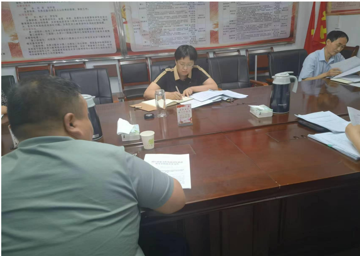
1.1.1图 教体局召开党建专题会，研究部署2022年党建工作

各职业学校党组织，深入推进全面从严治党，认真落实党风廉政建设主体责任和“一岗双责”，把党风廉政建设与职业教育教学各项工作同部署、同落实、同考评。组织党员干部认真学习贯彻《中国共产党廉洁自律准则》《中国共产党问责条例》等，不断加强党的纪律建设、作风建设和廉政建设。坚持开展“廉政文化进校园”活动常态化，不断增强广大党员干部的廉政意识和拒腐防变能力。