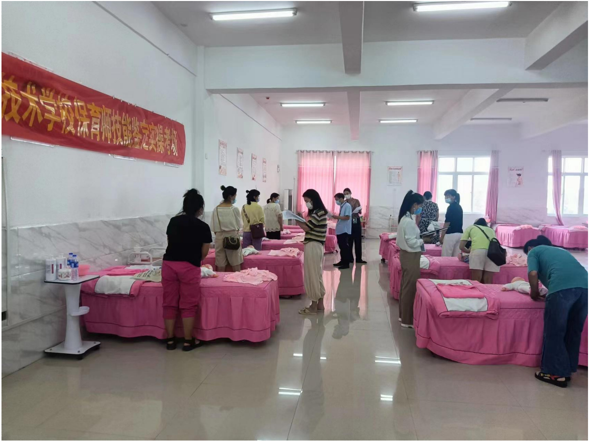
图 4.3.2 鹿邑县职业技术学校保育师技能鉴定理论考场

各职业学校利用专业优势，服务地方发展。为提升村民的思想素质，促进文明和谐乡风民俗的形成，鹿邑职业技术学校以乡村振兴为宗旨，以绘制文化墙为载体，搭建了学校和基层沟通的纽带，在环境、文化、生态等方面助推乡村文化的发展。