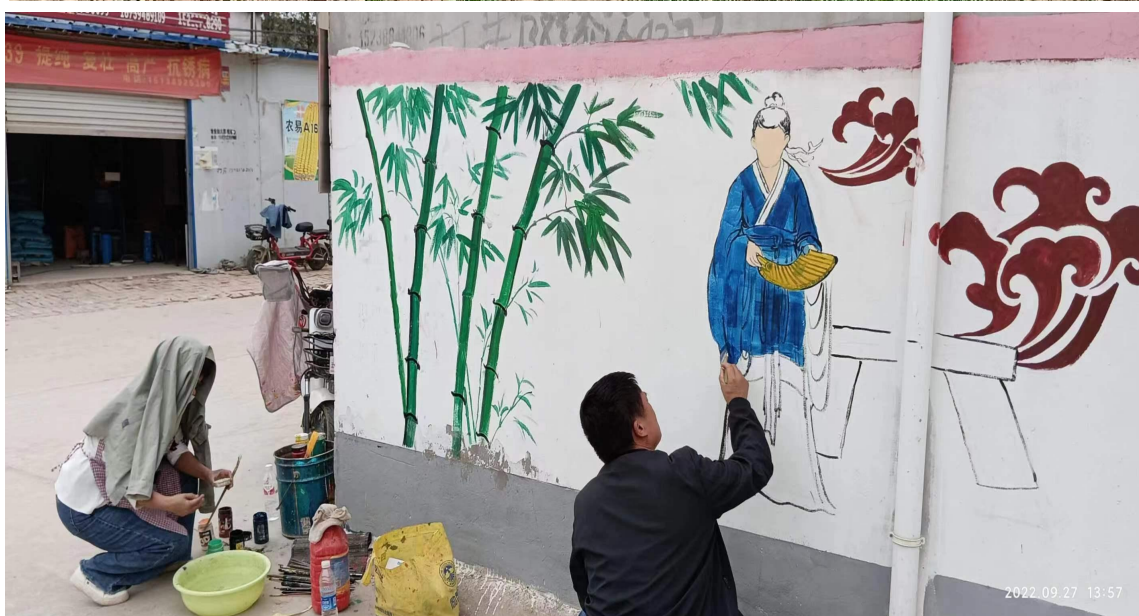
图4.3.3 鹿邑县职业技术学校绘画专业学生开展绘制文化墙活动

4.4 服务地方社区。 各校始终坚持“开放办学、服务社会”，充分发挥师资、设备条件等资源优势，为社会经济发展提供动力“引擎”。一是在保障学生正常实习的基础上，让专业课教师带领学生走出校园，走向社会，走向社区，为老百姓提供上门服务，受到社会各界的好评。二是组织计算机应用专业的学生在街头设立自动化办公服务点，为老百姓免费提供复印、打印等自动化办