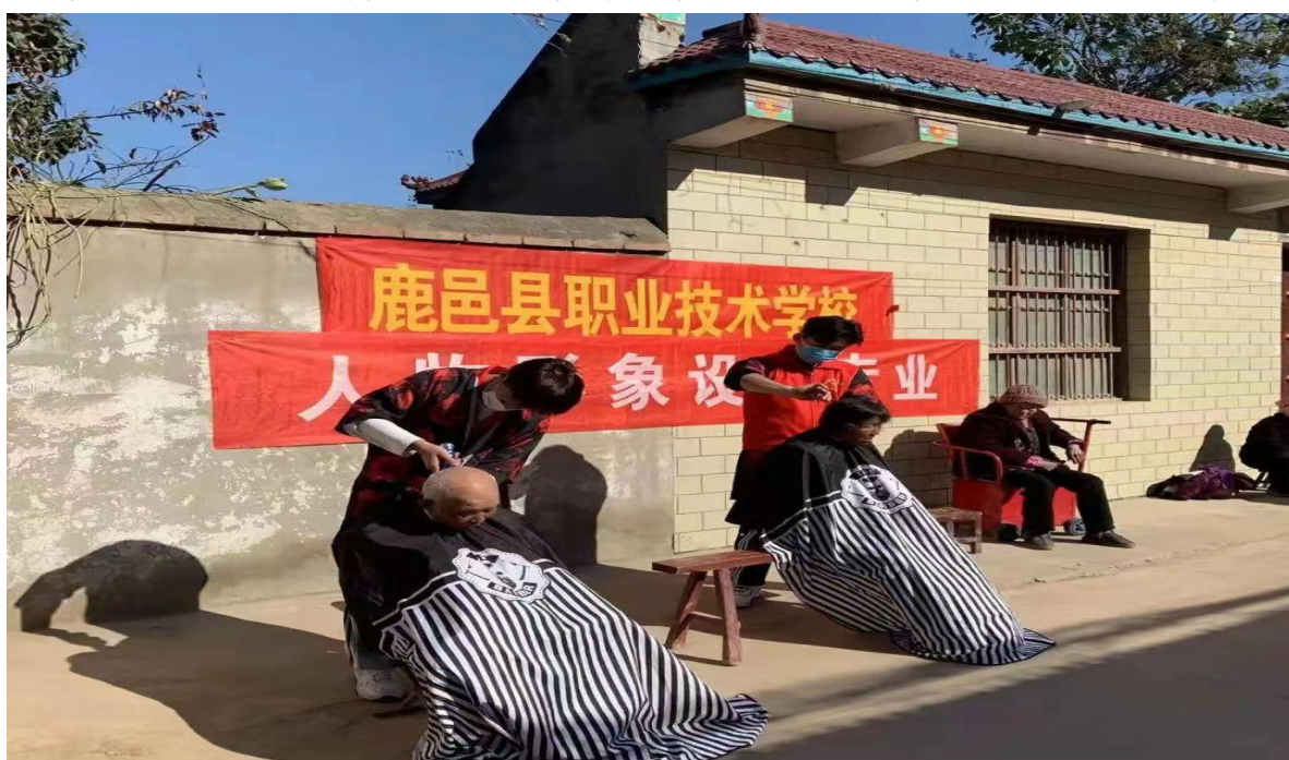
图 4.4.1 鹿邑县职业技术学校“美容美发”专业学生深入社区，开设免费理发。

公技术培训服务。三是选派骨干教师到社区参加电器维修等校外便民服务咨询点，帮助市民解决相关问题，普及电器使用等安全常识；学校美容美发专业深入社区，开设免费理发、一元理发服务，受到当地群众好评。既塑造了学校的良好形象，又给学生提供了良好的实践操作机会。四是积极倡导教职工义务到社区、敬老院等地开展捐赠、心理咨询、帮扶等“献爱心”便民服务。通过这些活动，向公众充分展示了职业教育改革发展成果，传播职业教育正能量、好声音、新形象，扩大了职业教育的社会影响力。