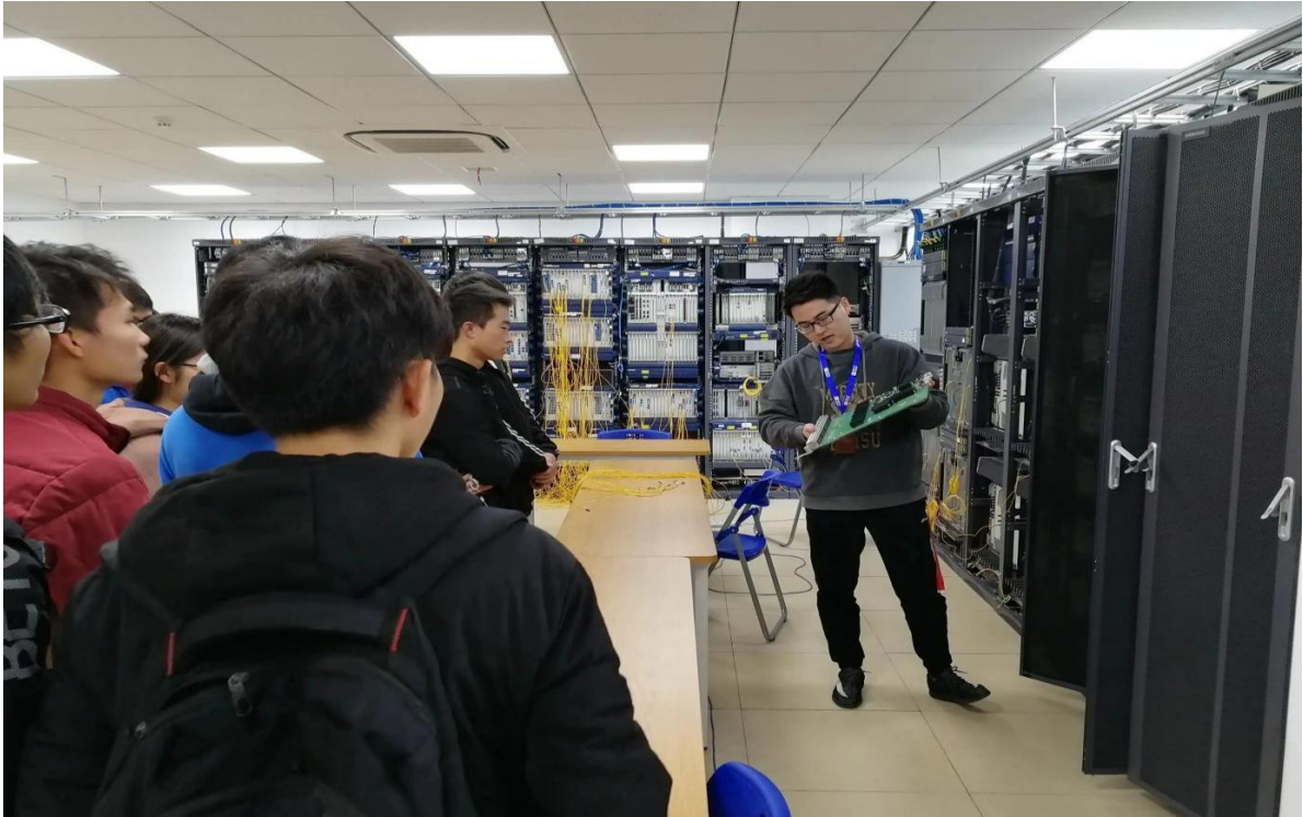
图2.3.1企业专业人士为我校学生讲解专业知识