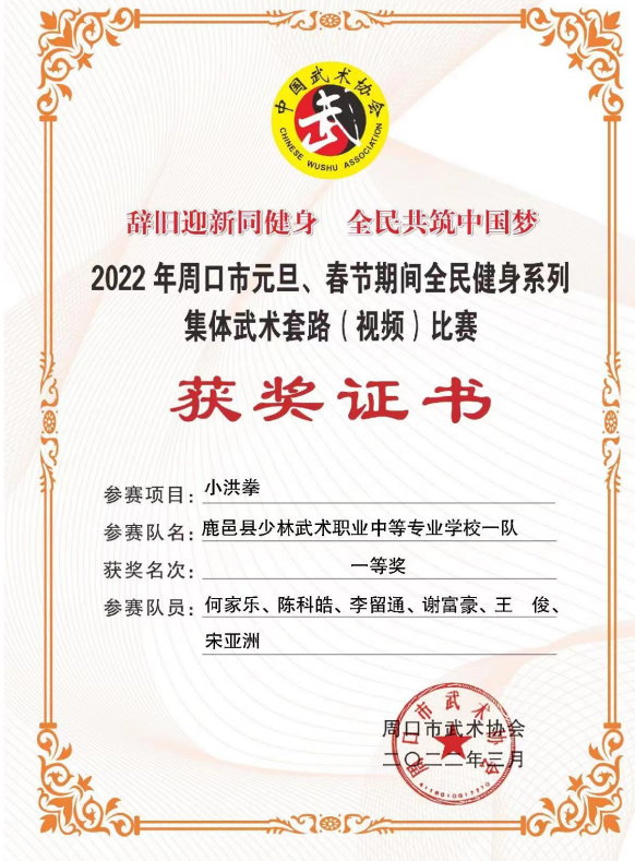
图1.6.3 “辞旧迎新同健身、全民共筑中国梦”全民健身系列集体武术套路（视频）比赛获奖证书