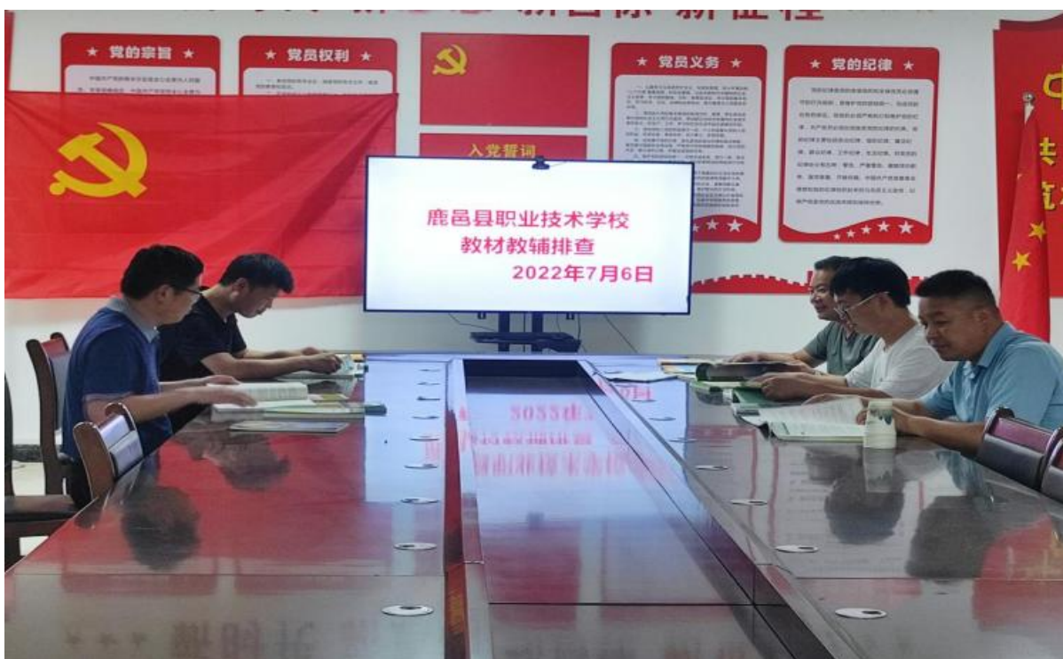
图 2.4 鹿邑县职业技术学校开展教材教辅专项排查活动

共基础课、专业课教材。专业技能课在选用国规、省荐教材的基础上,根据行业产业发展以及专业特点,联合行业企业及时更新、补充教学内容。各专业坚持优先选用项目任务式教材,优先选用同类高级别教材,优先选用近三年新出版教材。积极储备校本教材。