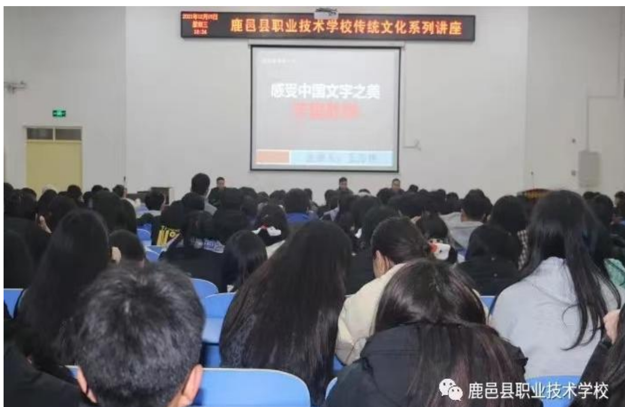
图1.3.1 鹿邑县职业技术学校组织开展传统文化系列讲座

门通过问卷、访谈、座谈会等形式对在校学生进行调查：超过90%的学生对理论学习、专业学习、实习实训方面感觉满意或基本满意，超过93%的学生对校园文化与社团活动方面感觉满意或基本满意，超过95%的学生对在校学习生活、学校安全方面满意度感觉满意或基本满意。