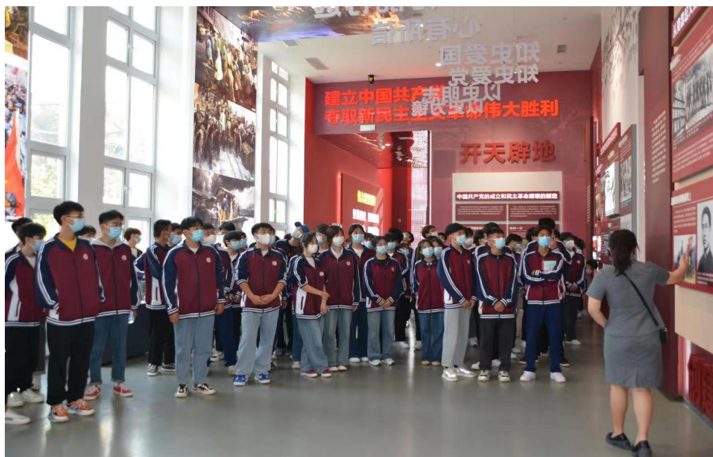
1.2.1图 鹿邑县职业技术学校组织学生参观党历史博物馆

1.3 在校体验。 全县各职业学校秉承“以人为本、关爱学生、培养学生、发展学生”的办学宗旨，落实“立德树人”根本任务，注重素质培养，坚持文化育人、活动育人，学生、家长、教职工及用人单位满意度高。