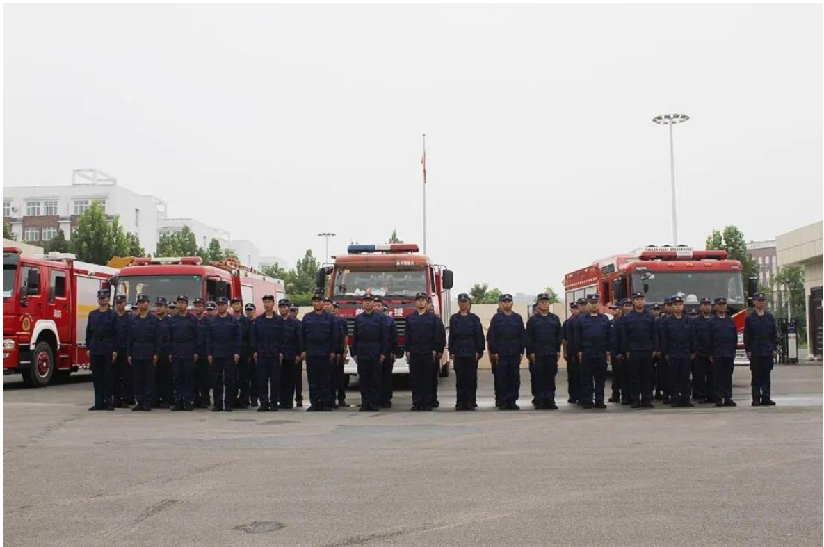
图 4.3.1 2022 年 8 月 16 日鹿邑县乡镇专职消防员结业典礼

培训全过程管理，全面运行河南省职业培训信息管理服务系统，实现“补贴性培训进系统、系统之外零补贴”。严格评价考核，建立与县人社部门的沟通、协调机制，接受县人力资源社会保障部门加强对考核、评价的全过程监管，提高培训质量。