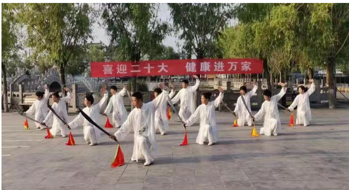
图4.5.1 举办“喜迎二十大 健康进万家”活动

行培训、实训及跟踪服务。同时，凭借其特色专业运动训练，瞄准县域企业开展校企合作，以满足县域人才需求为服务宗旨，同鹿邑县开发区签订劳务输出合同，学校每年定期向开发区企业输送安保人员，逐步形成职前职后培训、长短期学历进修等多层次、多种类的办学与培训体系，有效促进了职业教育的横向沟通与纵