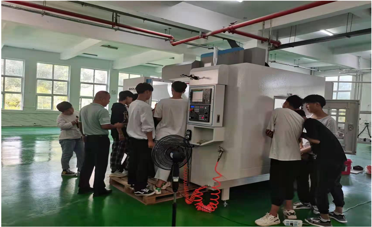
图4.1.2 2021 级数控机床班学生实操课