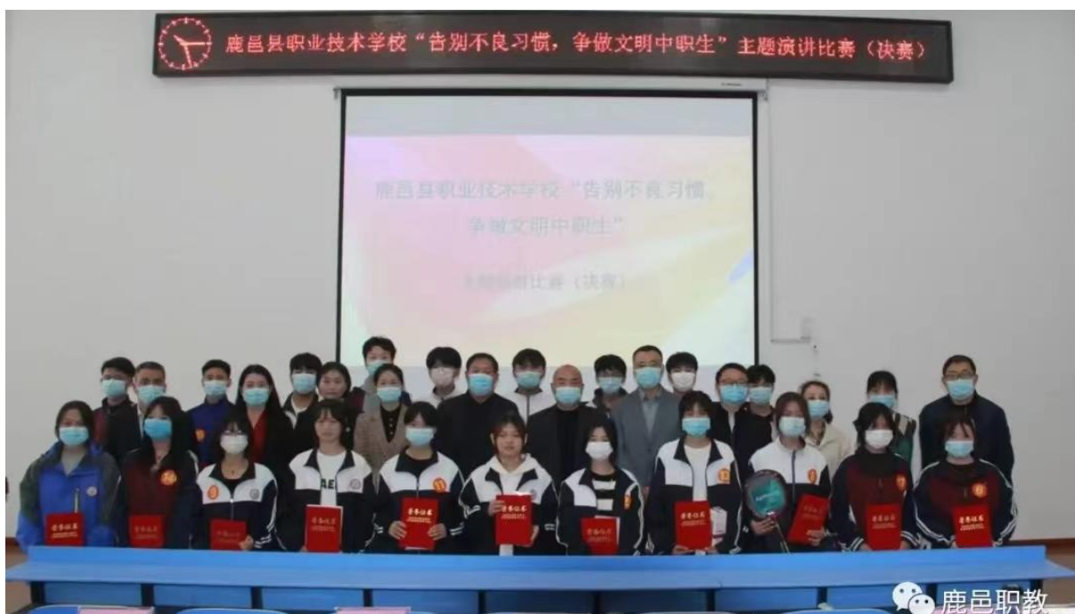
图1.3.2 鹿邑县职业技术学校开展文明主题演讲比赛

1.4就业质量。根据学生的专业特长和就业愿望，结合产业人才需求积极拓展学生就业渠道。本年度共有毕业生212人，其中151人升入高等学校。专业就业率90%，对口就业率80%，初次就业起薪平均3150元。雇主满意度达90%以上。