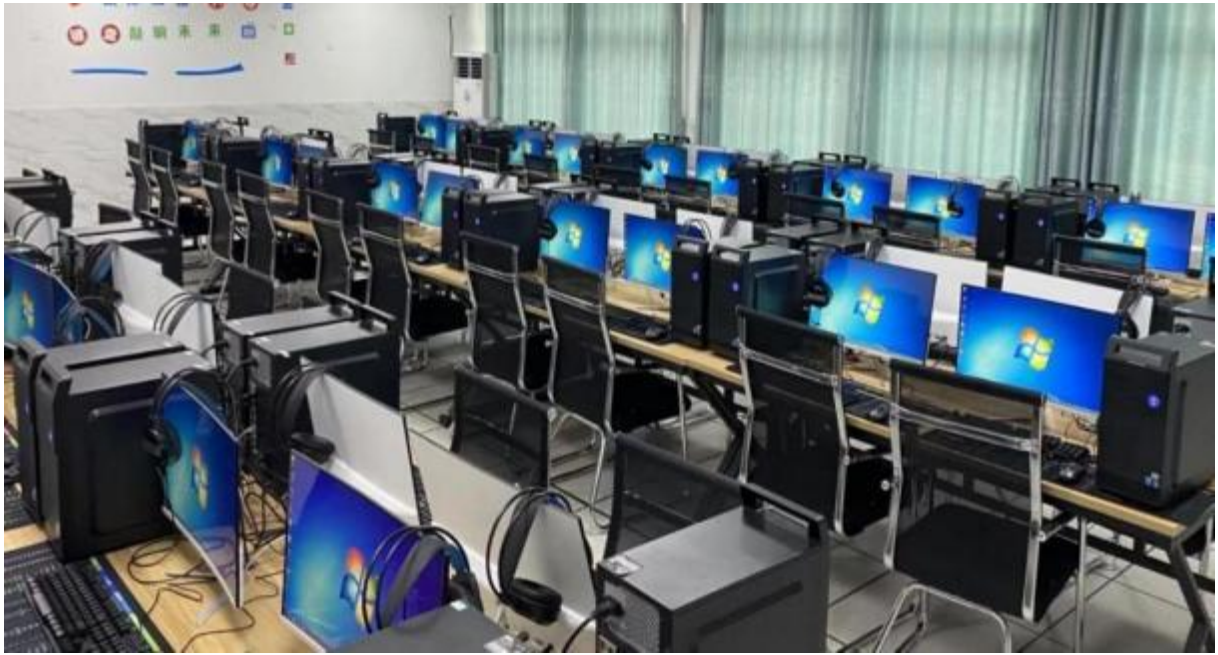
图 4：学校计算机教室场景