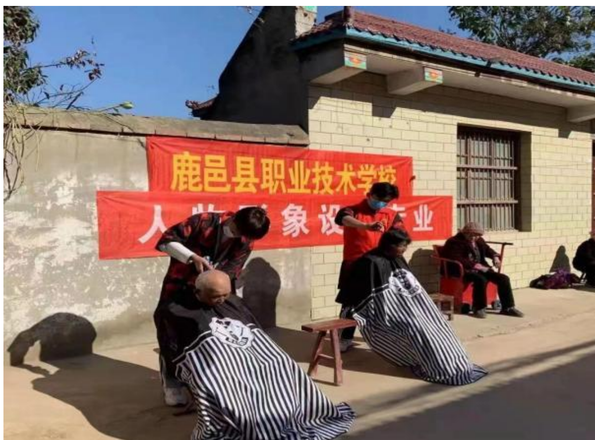
图 27：学校美发专业学生为老年人无偿理发

学校充分发挥师资、设备条件等资源优势，围绕行业、产业发展需要，加大社会服务工作力度，主动服务经济社会发展大局。积极开展长、短期职业培训社会服务能力显著提升。利用职业教育活动周，深入社区为民服务。本年，面向行业、企业、幼儿园等开展多层次专业学历教育培训 600 人次，面向全县各企业、行政、事业单位职工开展技能提升培训 3305 人次，涵盖了安全员、电子商务师、保育师、电工、计算机维修工、美容师、美发师、汽车维修工、农业技术员、中式烹调师等多个专业、工种，为区域社会发展、“人人持证 技能河南”建设工作做出了重要贡献。