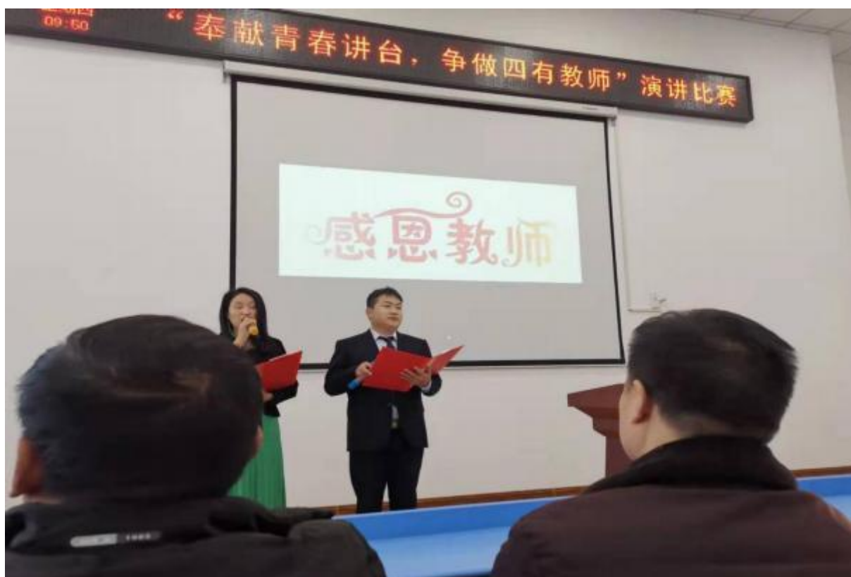
图 38：学校开展“奉献青春讲台，争做四有教师”演讲比赛