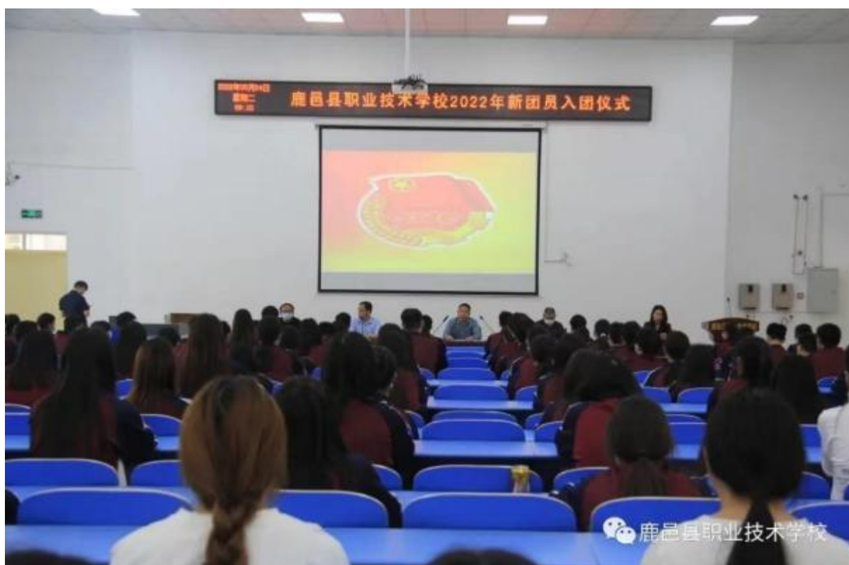
图 30：学校开展德育活动