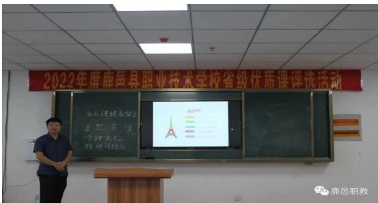
图 17：学校开展优质课评选活动

教学评价。认真开展教学方式、学习方式和评价方式等方面的研讨，以适应教改要求。尤其是对中职教材的改革、教师和学生的评价、教学管理模式，积极探索，认真指导，充分发挥。评价对学生、教师、学校教育的导向。鉴别诊断、激励、监控与管理作用，逐步形成包括与他人比较、与自己比较、与课程比较三个维度的学生测评与教学质量分析机制进行教学改革加强分省教学研究，开展丰富多样的课内外教育活动，因材施教，尊重学生差异，提供各种学习选择。在课堂教学中，对优生以防为主，防中有福，重在引导学生自己动手，发挥潜力，逐渐完成相应的目标，达到学会创新的高度，对中等生和后进生以服务为主，福中有放，重在带领学生多重复、找规律，逐渐完成相应的目标，达到学会会学的目标。对基础差的学生，由课前预习做铺垫，有课后作业住台阶，以帮助他们跟上班级学习的步伐。