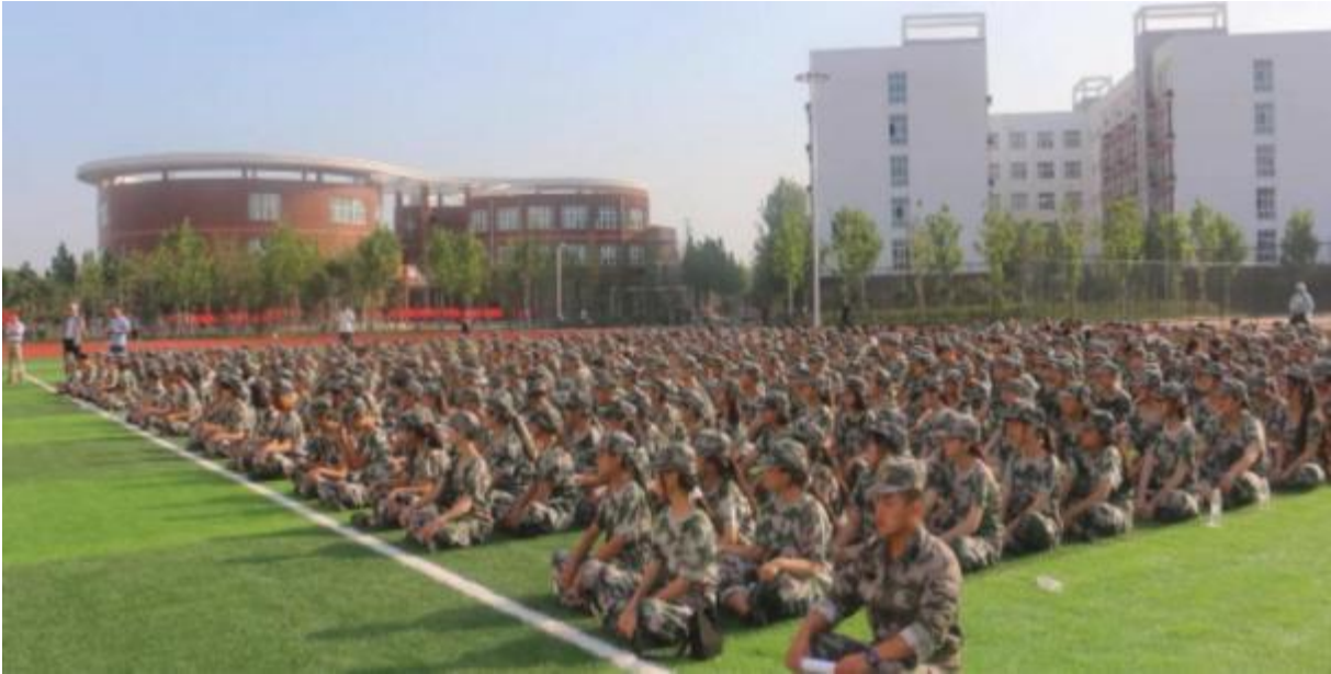
图 3：学校组织军训汇演