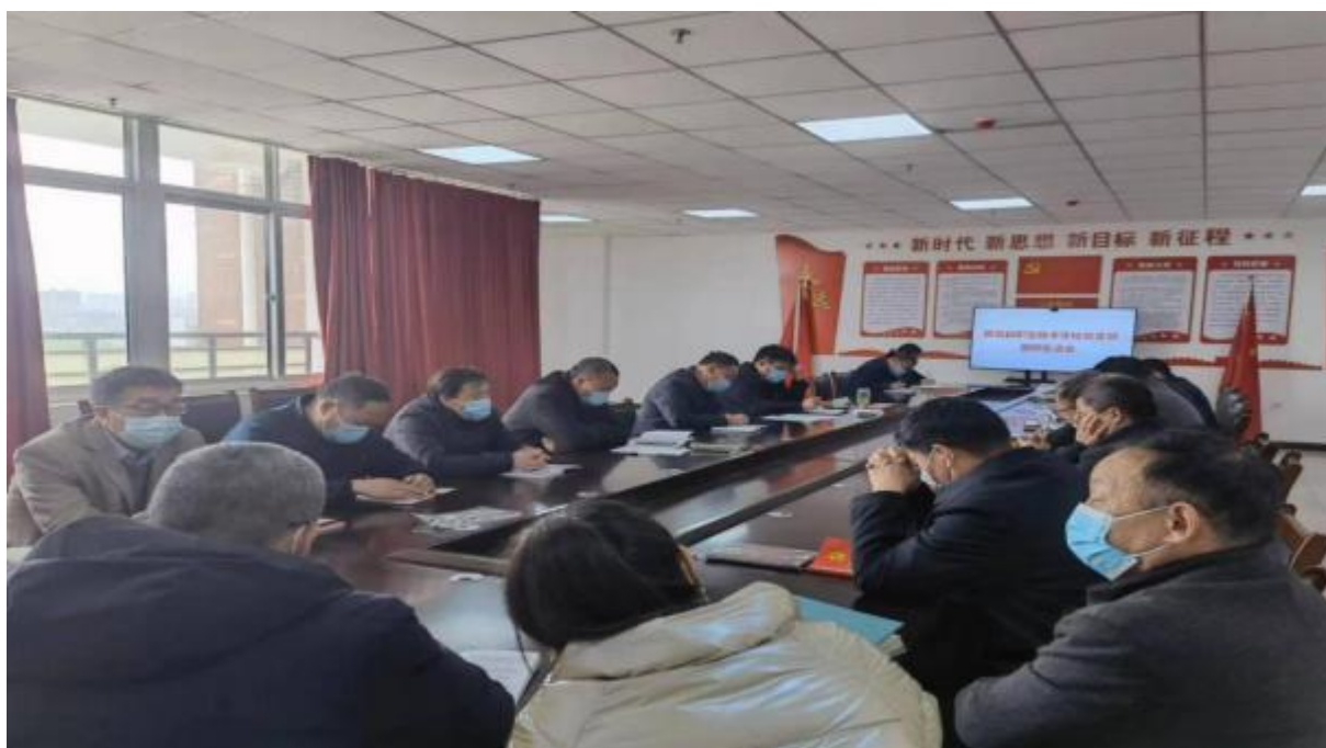
图 9：学校党支部开展工作会议

装全体党员为根本任务，坚持正面教育为主、理论武装先行，教育引导全体党员进一步坚定理想信念，进一步增强“四个意识”“四个自信”，严守政治纪律，树立清风正气，强化宗旨观念，勇于担当作为，在教书育人、服务育人、管理育人中发挥示范引领作用和先锋模范作用，保证党的路线方针政策及时得到贯彻和落实。始终把政治建设放在首位抓紧抓实，着力打造一支理想信念坚定、政治素质过硬的教职工队伍，为全面提升办学水平提供坚强的思想保证和组织保障。全年没有发生一起违反师德、违反党纪党规的行为。