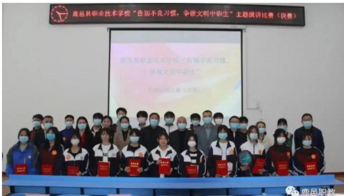
图 29：学校开展文明主题演讲比赛