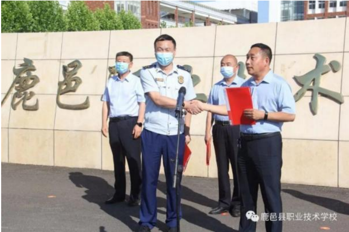
图 43：应急管理揭牌仪式