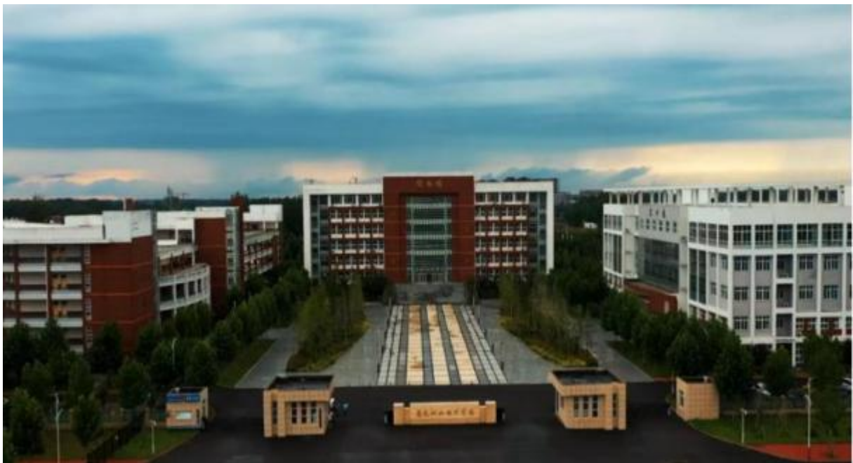
图 1: 鹿邑县职业技术学校教学楼全景

鹿邑县职业技术学校是一所公办学校 2020 年 09 月投入使用,位于鹿邑县西关鹿穆路北侧,校园环境优美,生活设施齐全。学校集中职学历教育和短期培训于一体,多层次、多渠道、全方位