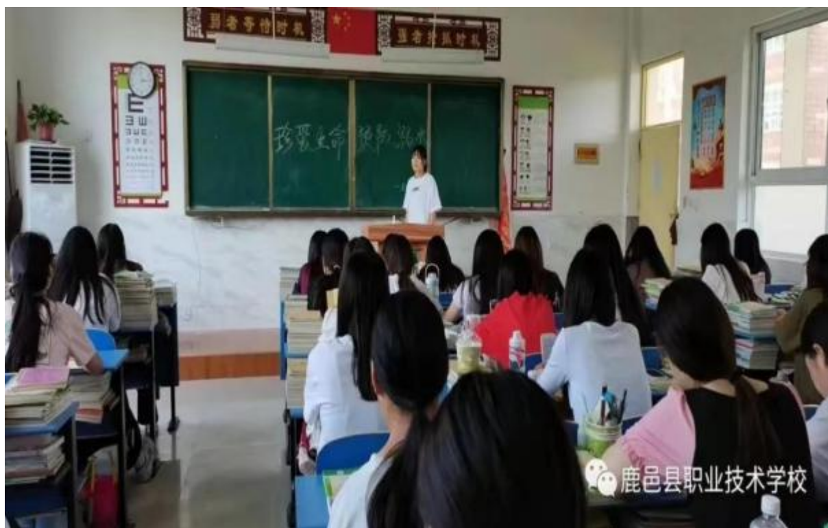
图 34: 社团活动场景二