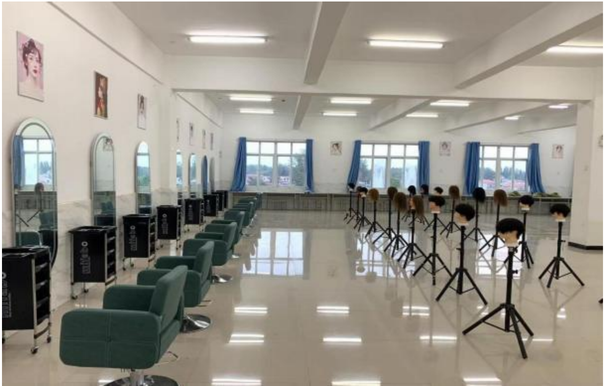
图 15: 美容美发实训教室实景