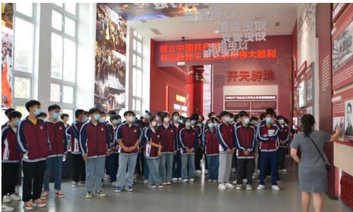
图 10：组织学生参观党历史博物馆