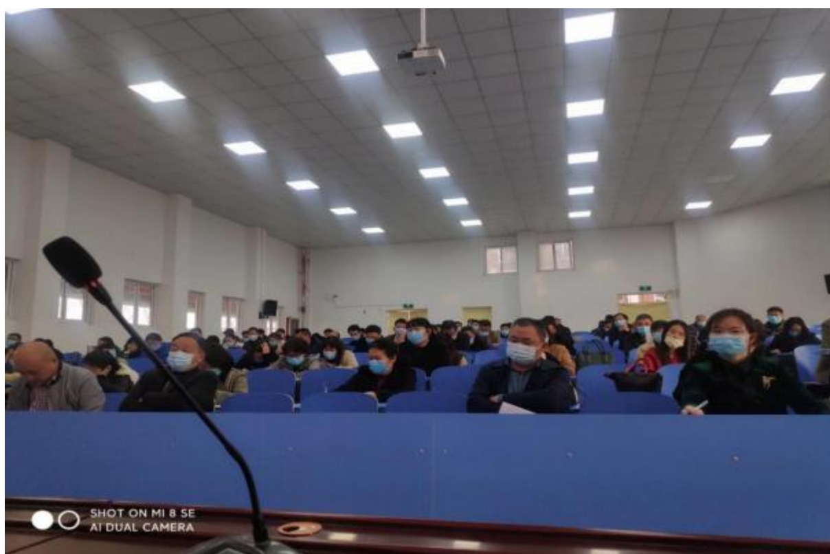
图 39：学校召开主题会议