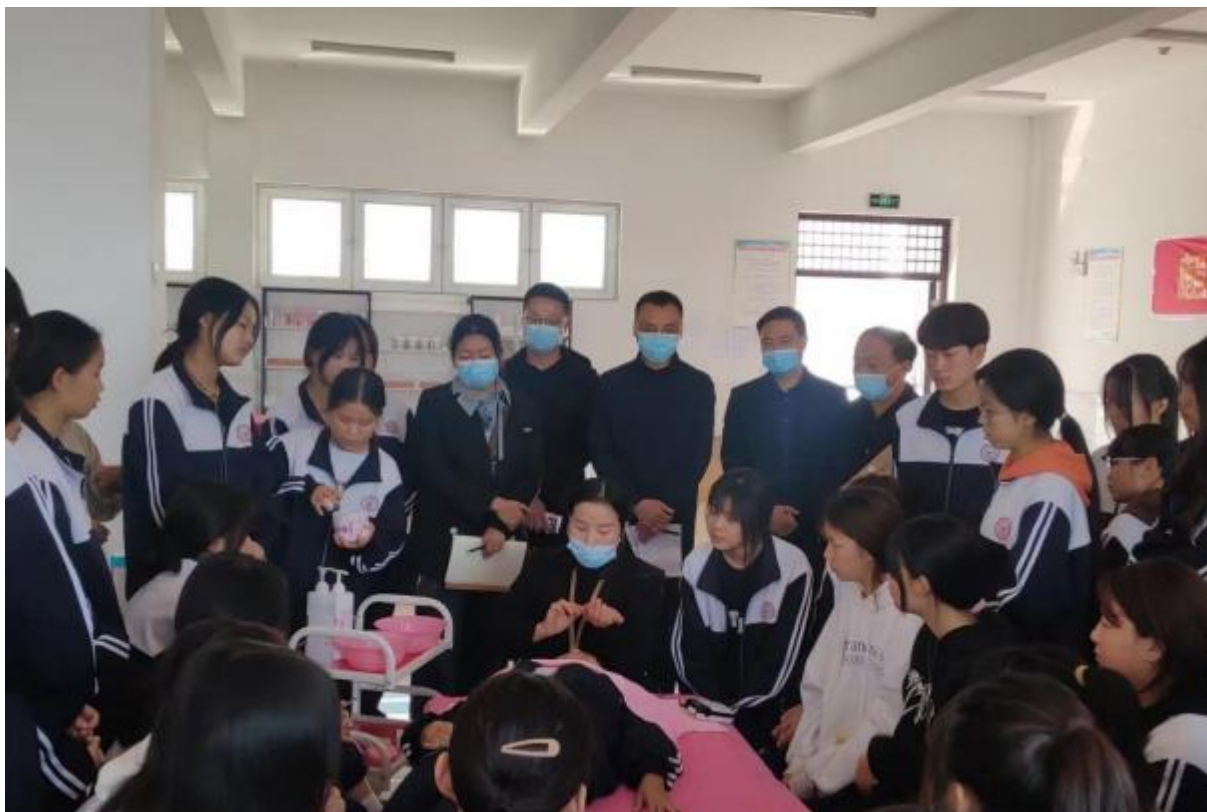
图 28：教师进行场景教学