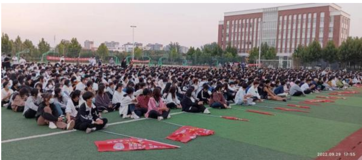
图 2：学校开展全体学生动员大会

招生规模：本年秋季共招生 552 人。总人数是 1300 人。在校生规模：全日制学历教育在校生 1179 人，非全日制学历教育在校生 121 人。毕业生规模：共毕业 122 人，(直接就业 10 人，112 人升入高一级学校，就业率 90%)。学生结构：男女比例为 5.2:4.7。学生巩固率88%。面向全县各企业及行政事业单位开展技能提升岗位培训 3305 人次，结业率 100%。与上一年度相比全日制在校生增加 168 人，学生巩固率提高 8 个百分点。