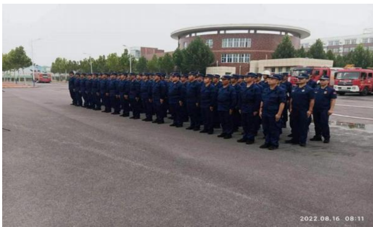
图 35：学校开展安全训练

学校不断完善安全管理制度，完善了《学校安全事故报告制度》、《学校安全工作检查制度》、《学校安全隐患整改制度》、《预防校园暴力和欺凌工作方案》、《学生安全管理制度》、《学校应急疏散演练管理制度》、《学校食堂安全管理制度》等多项制度。加强人防、物防、技防的建设，做好安全宣传教育，值班人员不间断对校区进行全方位无死角的巡逻，提高安全防范水平。加强消防安全管理，配备灭火器，加强对人员密集场所和安全出口、疏散通道管理，定期维修消防设施、器材。增加安全消防演练次数。加强用火、用电、用气安全管理，及时改造不合理用电线路。加强学生宿舍管理，严禁学生私拉电线、私用电器及蜡烛照明。加强饮食卫生安全管理，定期对学校校舍、教学设备、设施进行安全检查，把问题解决在萌芽状态。