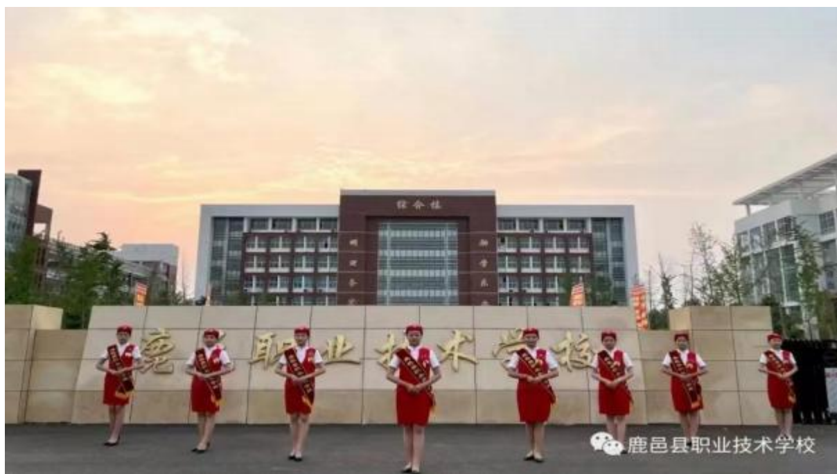
图 16：学校组织经典诵读比赛开场