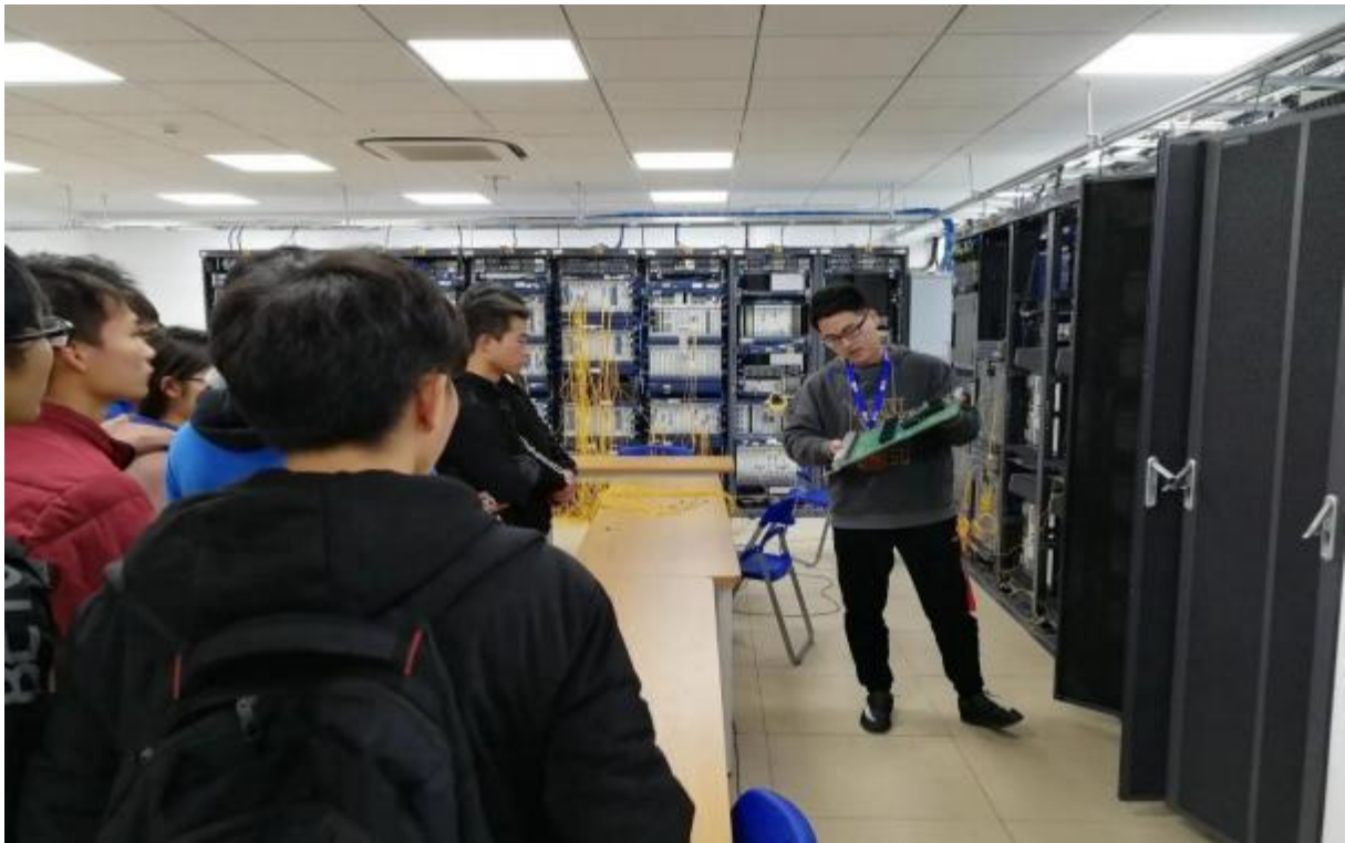
图 23：企业专业人士为我校学生讲解专业知识