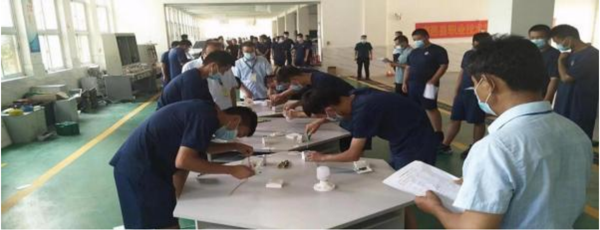
图 13：学生进行日常考核