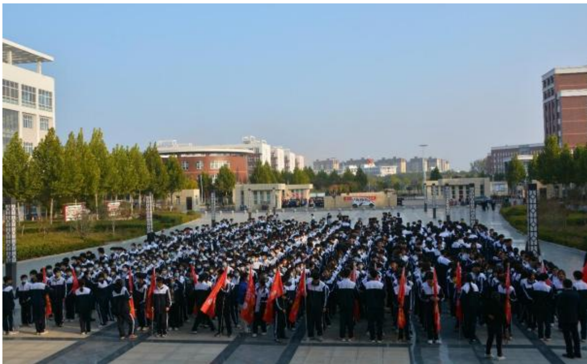
图 11：学校开展校园文化活动