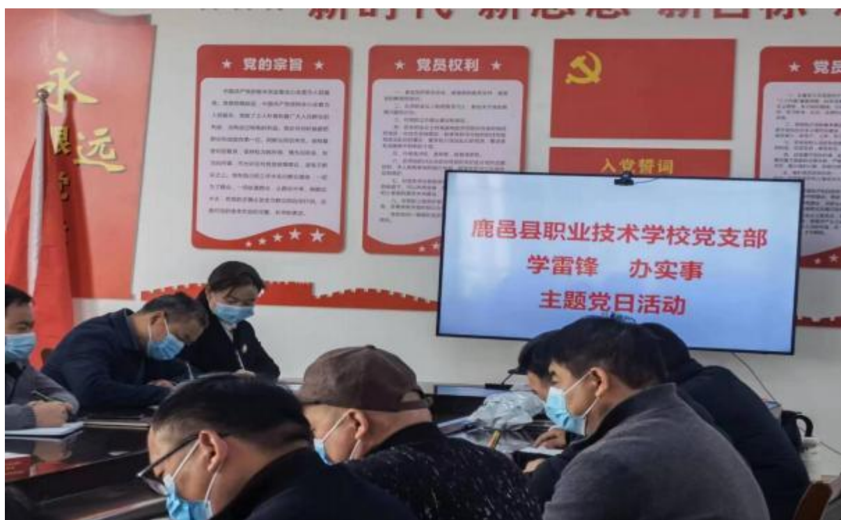
图 8：学校党支部开展《学雷锋、办实事》主题党日活动

41 人，本年预备党员转正 1 人，发展入党积极分子 3 人。校党工 位深入推进学习型党组织建设，建立党员活动室，建立健全党员 活动制度，定期开展“主题党日”活动。积极加强基层党组织建 设，认真落实“三会一课”制度，使基层支部真正成为教职工干 事创业的领导和联系纽带。