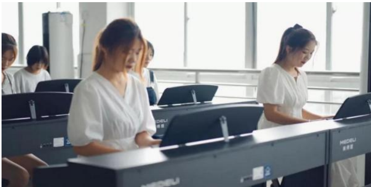
图 20：音乐专业学生上课场景

个、钢琴房 1 个、形体房 1 个、声乐室 2 个、茶艺室、化妆室、美发室、新能源汽修、中餐烹饪、数控车床实训室实操室各 1 个、健身房共计 11 个校内实训基地。