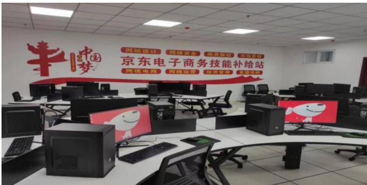
图 45：京东电子商务实训教室实景一

为了培养符合互联网新经济业态发展需求的网络营销人才、直播电商人才为目标，京东电商专业采用校企优质师资联合授课，提倡和鼓励学生创新创业，帮助学生掌握成功通往职场的诀窍，拥有网络营销与直播电商人才的核心竞争力。