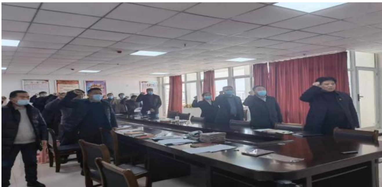
图 7：学校全体党员在鲜红的党旗下宣誓

校党支部把培育和弘扬社会主义核心价值观作为强基固本的灵魂工程，积极加强宣传阵地建设，积极倡导“做文明人，办文明事”，不断推进“文明单位”建设。通过升旗仪式、主题班会、校园广播、宣传栏，对学生深入开展正确的世界观、价值观和人生观“三观”教育，扎实抓好学生日常行为规范教育，强化学生遵规守纪意识。组织教职工深入学习领会习近平新时代中国特色社会主义思想，积极完善政治学习制度，全面加强思想政治工作。积极创新学习方式，加强中国特色社会主义理论体系教育，不断提高教师的理论修养和思想政治素质。积极构建师德建设长效机制，深入开展师德师风教育，增强广大教职工爱岗敬业、恪尽职守的事业心和责任心。