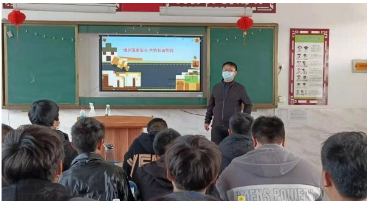
图 36: 班主任开展安全主题班会