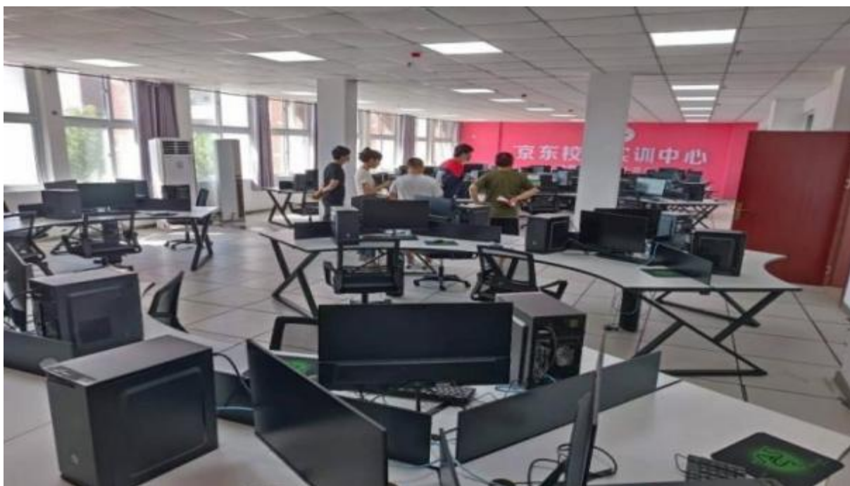
图 19：管理信息化推进会

校园安装了全方位监控系统，建设了财务管理系统、资产管理系统、教务管理系统、教师信息管理系统、校园广播和打铃系统、学生学籍信息管理系统、学生资助信息管理系统和学生资助监管面部识别系统等。逐步加快校园信息化建设步伐，尽快实现教学、办公、管理数字化。