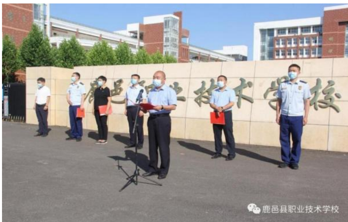
图 42：应急管理揭牌仪式

应急救援机构大力支持下，签署校地合作协议，合作共建，优势互补，多元办学，互惠共赢，不仅有力地促进了应急理论和实践的结合，而且拓宽的学员实训和就业渠道，为鹿邑乃至河南应急能力提升提供了人才储备和有力支撑。