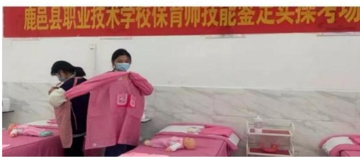
图 26：学校开展专业技能实操考试