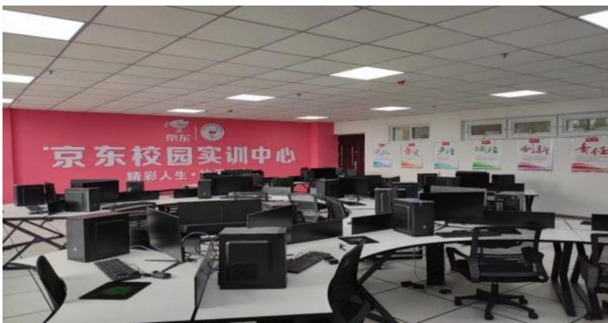
图 46：京东电商实训教室实景二