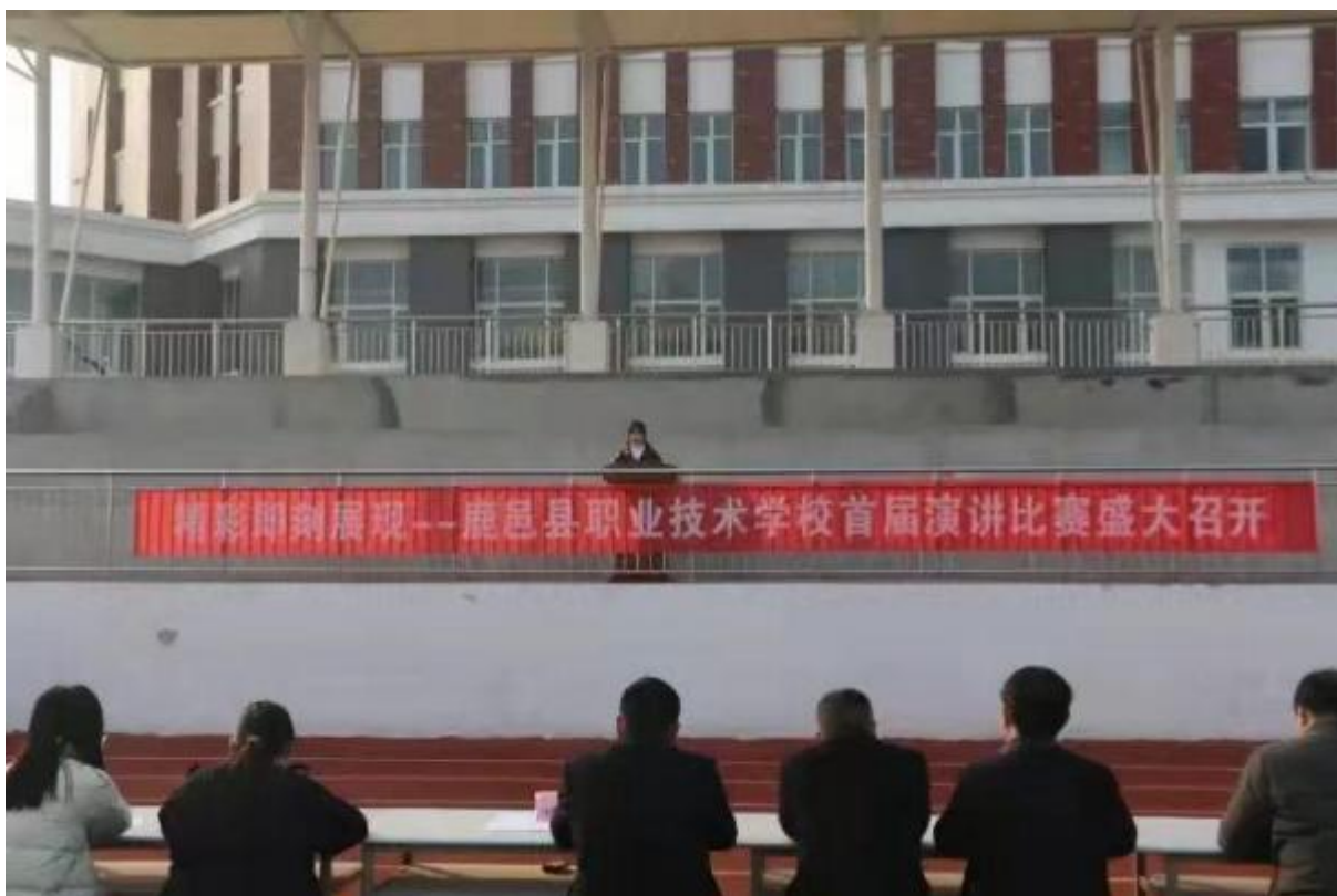
图 31：学校开展演讲比赛