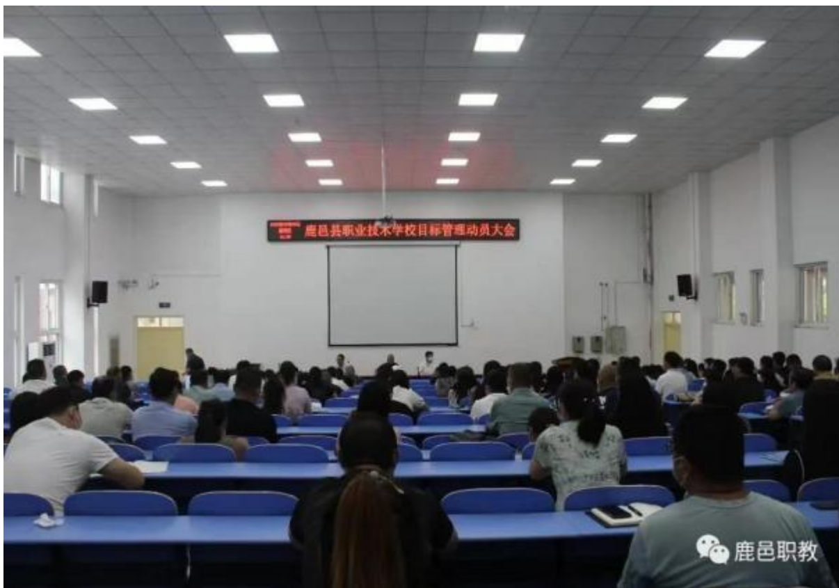
图 22：学校开展全体教师会议