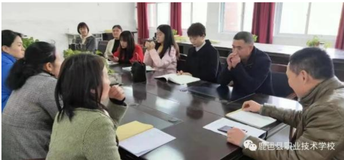
图 37：教研组开展问题研讨会