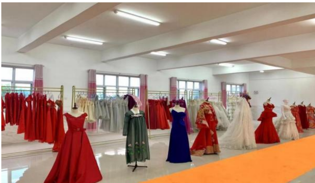
图 21：服装设计专业教室场景