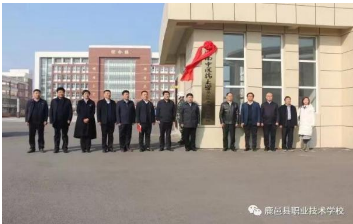
图 24 河南中医药大学领导与县领导合照