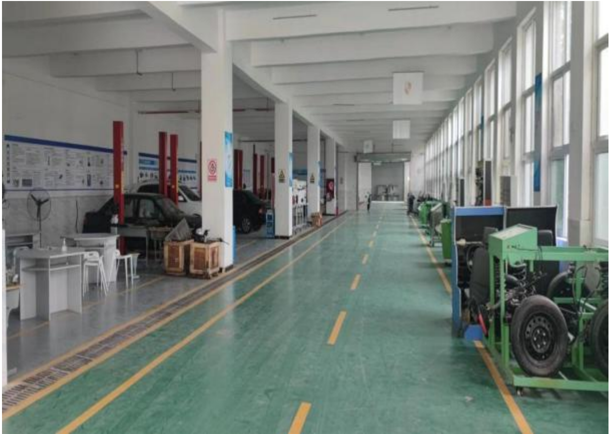
图 5：汽修专业课实训机房