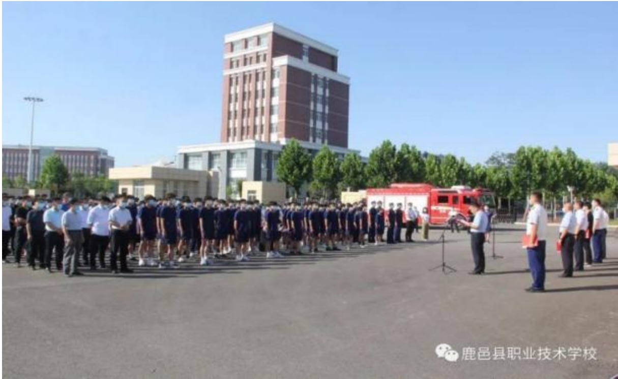
图 44：应急管理揭牌仪式