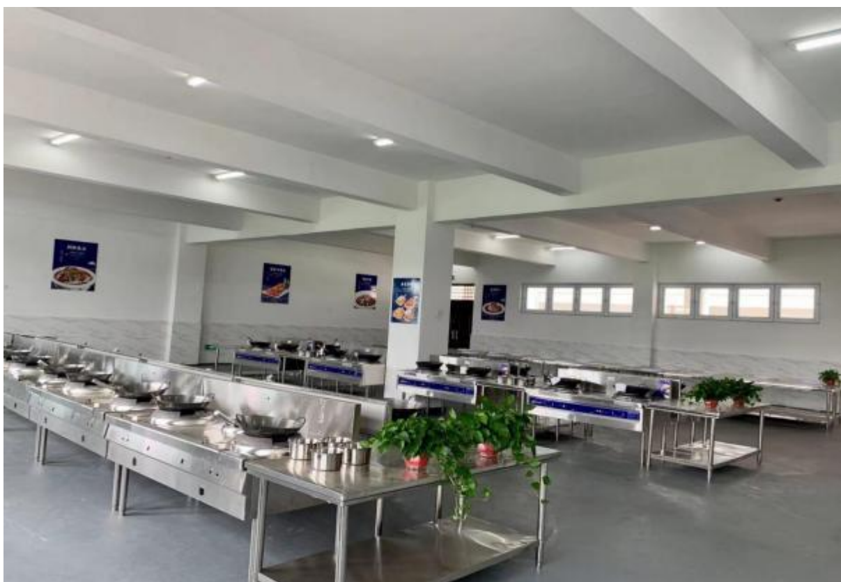
图 14：中餐烹饪实训教室实景

学校制定了人才培养方案，并根据国家、省指导性人才培养方案和用人单位需求适时进行调整，构建以能力为本位、以职业实践为主线、以项目课程为主体的方向化专业课程体系，合理确定公共基础课和专业技能课学时比例，专业技能课时开设比例均能达到60%以上，并根据行业产业发展及时修订。