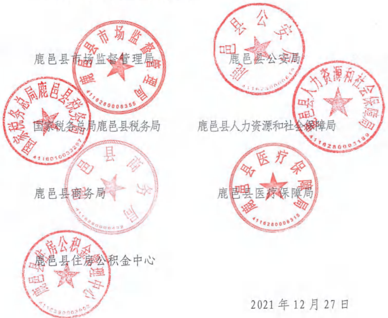
附件：鹿邑县企业注销流程图

主动做好与相关部门的业务协同和信息共享，确保改革各项工作落实到位。要加大对企业注销政策的宣传解读力度，加强业务培训，确保相关人员全面了解各项具体措施，提升企业注销服务水平，切实解决企业在注销中遇到的实际困难。要加强对企业的法律法规宣传，让企业明确知晓在注销退市时应当履行的法律义务和社会责任。